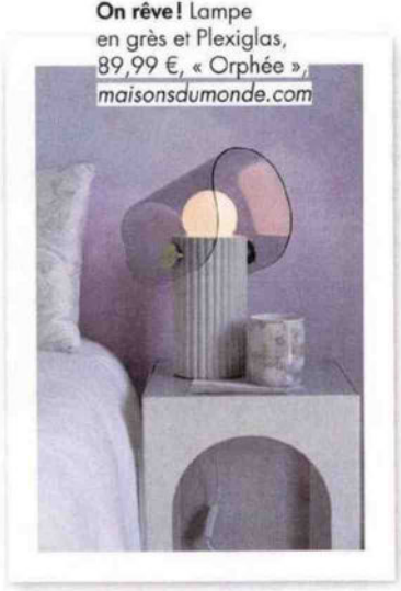
On rêve! Lampe en grès et Plexiglas, 89,99 €, « Orphée », maisonsdumonde.com