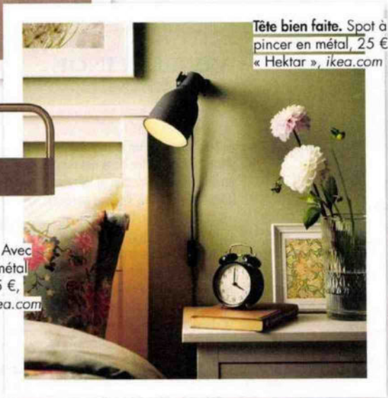
Tête bien faite. Spot à pincer en métal, 25 €, « Hektor », ikea.com