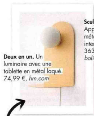
Deux en un. Un luminaire avec une tablette en métal laqué. 74,99 €, hm.com