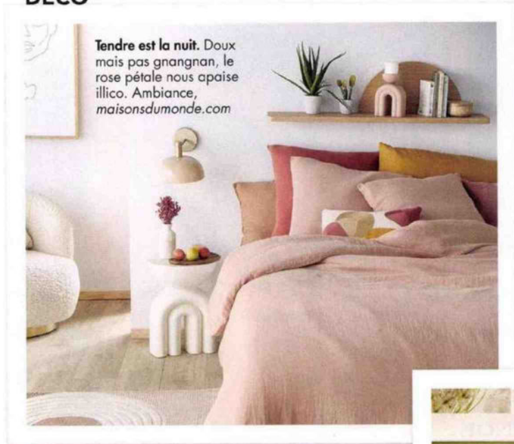
Tendre est la nuit. Doux mais pas gnangnan, le rose pétale nous apaise illico. Ambiance, maisonsdumonde.com