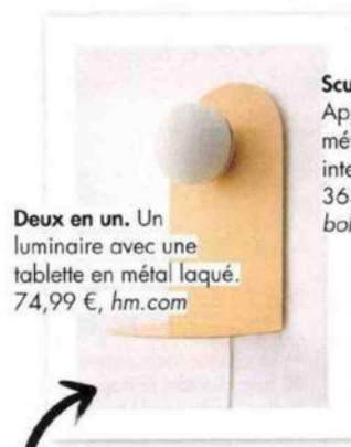
Deux en un. Un luminaire avec une tablette en métal laqué. 74,99 €, hm.com