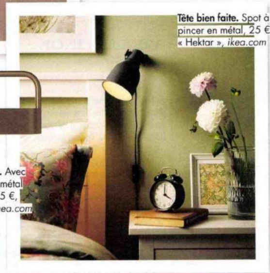
Tête bien faite. Spot à pincer en métal, 25 €, « Hektar », ikea.com