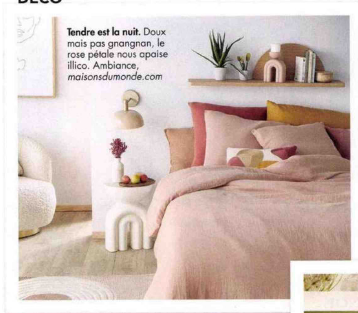
Tendre est la nuit. Doux mais pas gnangnan, le rose pétale nous apaise illico. Ambiance, maisonsdumonde.com