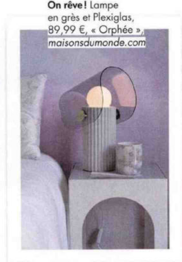
On rêve! Lampe en grès et Plexiglas, 89,99 €, « Orphée », maisonsdumonde.com